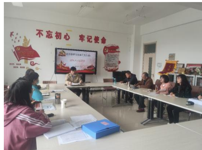
教职工支部开展理论学习

学院以党总支理论学习中心组为引领，以各党支部党员教育为重点，以教职工政治理论学习为抓手，以主题教育为契机，持续强化党的政治理论武装，坚持学思用贯通、知信行统一。旗帜鲜明的教育引领全体师生员工，坚定“四个自信”，增强“四个意识”，做到“两个维护”。努力使全院各党支部和广大党员、师生员工始终保持统一的思想、坚定的意志、协调的行动、强大的战斗力。