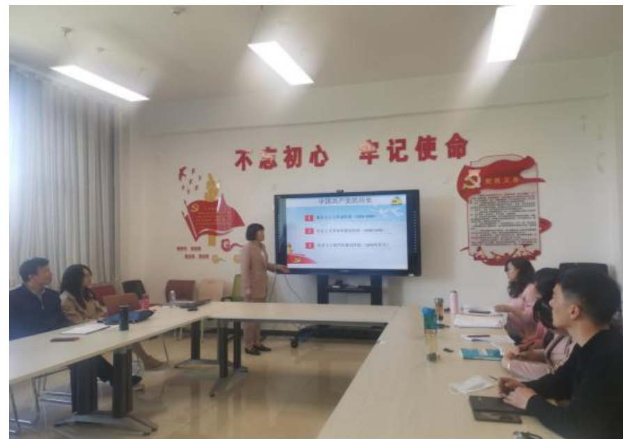
教工党支部开展党史教育主题党日活动

“三全育人”综合改革成果。充分利用微信公众号、班会、团日活动、宣传栏等各种线上线下载地，坚持弘扬社会主义核心价值观，在全体师生强化宣传教育，牢牢掌握意识形态工作的主动权。