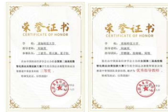
全国第二届高校数智化商业决策创新大赛

以“课间育人”为载体，施行“支部+活动”模式，把立德树人根本任务全方位延伸拓展到课余课外。组织引导党支部采取多种形式，针对学生的兴趣合理安排课间课余活动，指导学生社团丰富活动内容，将艺术、体育、特色创建融为一体，带领学生进行多次参加沙盘模拟大赛、旅游营销策划大赛、创新创业大赛及各类演讲等比赛，获得优异成绩。把社会主义核心价值观培育践行贯穿学生专业课实践教学、社会实践活动、创新创业教育、志愿服务等过程，增强思想引领和价值观塑造的实效性。