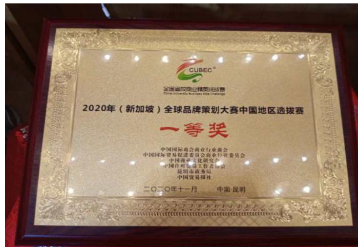
(新加坡) 全球品牌策划大赛