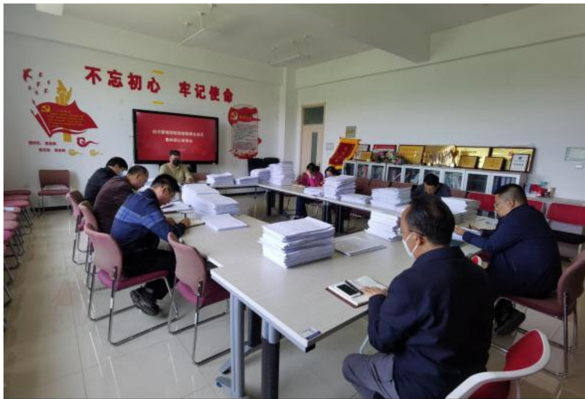
经济管理学院召开教师党员集体谈心谈话会

以“教书育人”为载体，施行“支部+名师”模式，强化全体教师立德树人的责任意识。充分发挥党支部在专业建设、素质教育、技能训练中的重要作用，引导教工党员全面贯彻党的教育方针，牢固树立育人为本、德育为先的理念，既当好知识和能力的传播者，更当好学生思想品德的培养者。学院青年教师导师充分发挥“传帮带”作用，在教学工作中做到热爱学生、以情育人；以言导行，引领示范；以才育人，诲人不倦；爱岗敬业，严谨治学，把培育和践行社会主义核心价值观融入教书育人全过程。