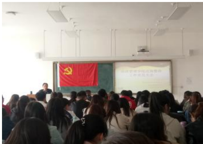
召开“党的基本知识集中教育”大会