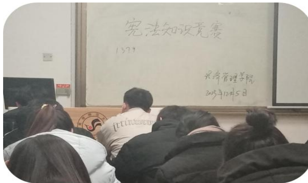
经济管理学院组织开展宪法知识竞赛活动

开展内容丰富、形式多样的理想信念专项活动，探寻学生感兴趣的内容和形式，将团学活动拓展到课外、校外，调动学生的积极性。