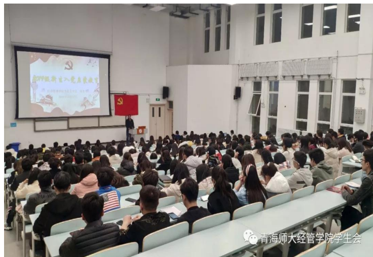
开展新生入党教育活动